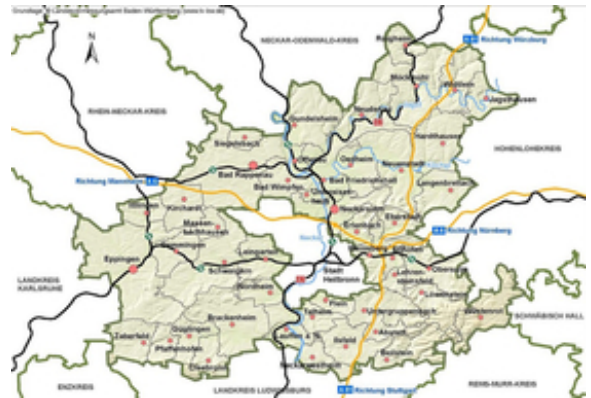
Landkreiskarte Heilbronn (2017, LRA-HN)

Aber wie du auf der Karte siehst, ist der Stadtkreis keineswegs quadratisch. Wenn man zwischen den am weitesten voneinander entfernten Punkten auf der Stadtkreisgrenze eine Schnur spannen könnte, bräuchte man davon fast 20 Kilometer! Und wenn du einmal Heilbronn auf der Stadtkreisgrenze umrunden wolltest, solltest du besser ein Fahrrad nehmen, denn die ist 72 Kilometer lang.